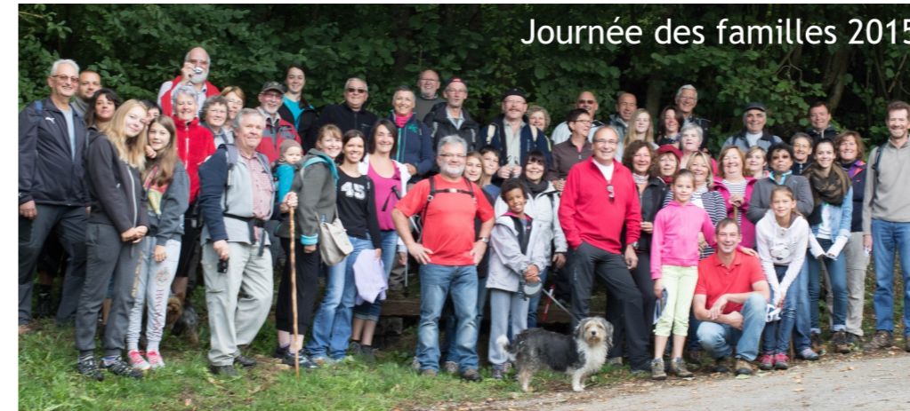
Journée des familles 2015