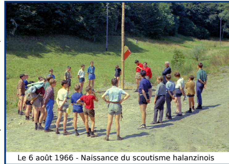
Le 6 août 1966 - Naissance du scoutisme halanzinois