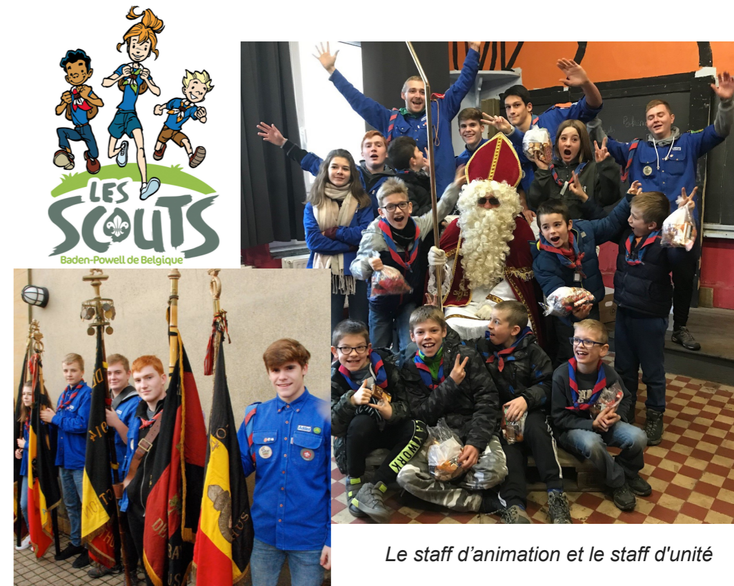
Le staff d'animation et le staff d'unité

Les scouts vous souhaitent une bonne et heureuse année 2019